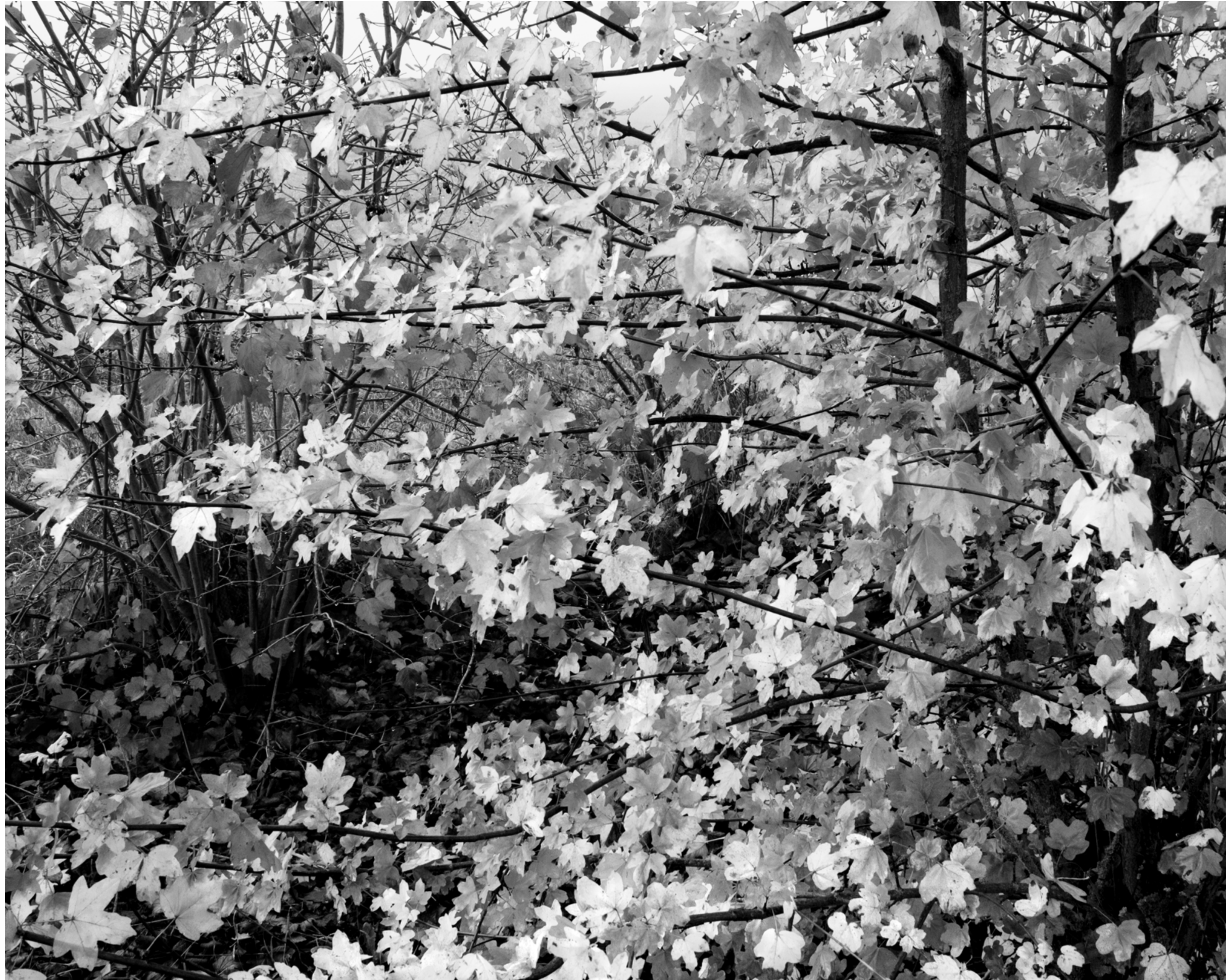
The fog outside the gate, #018