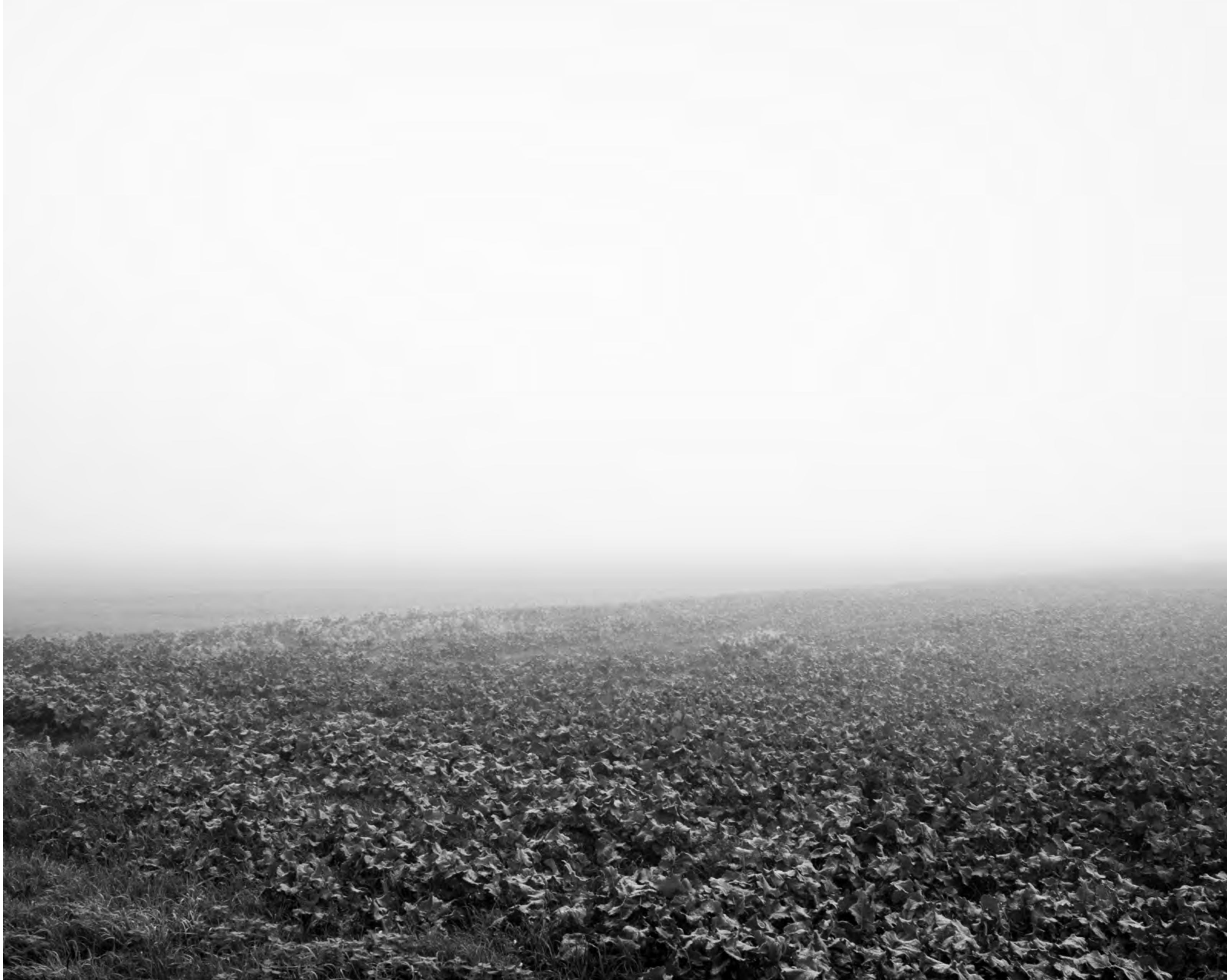
The fog outside the gate, #013