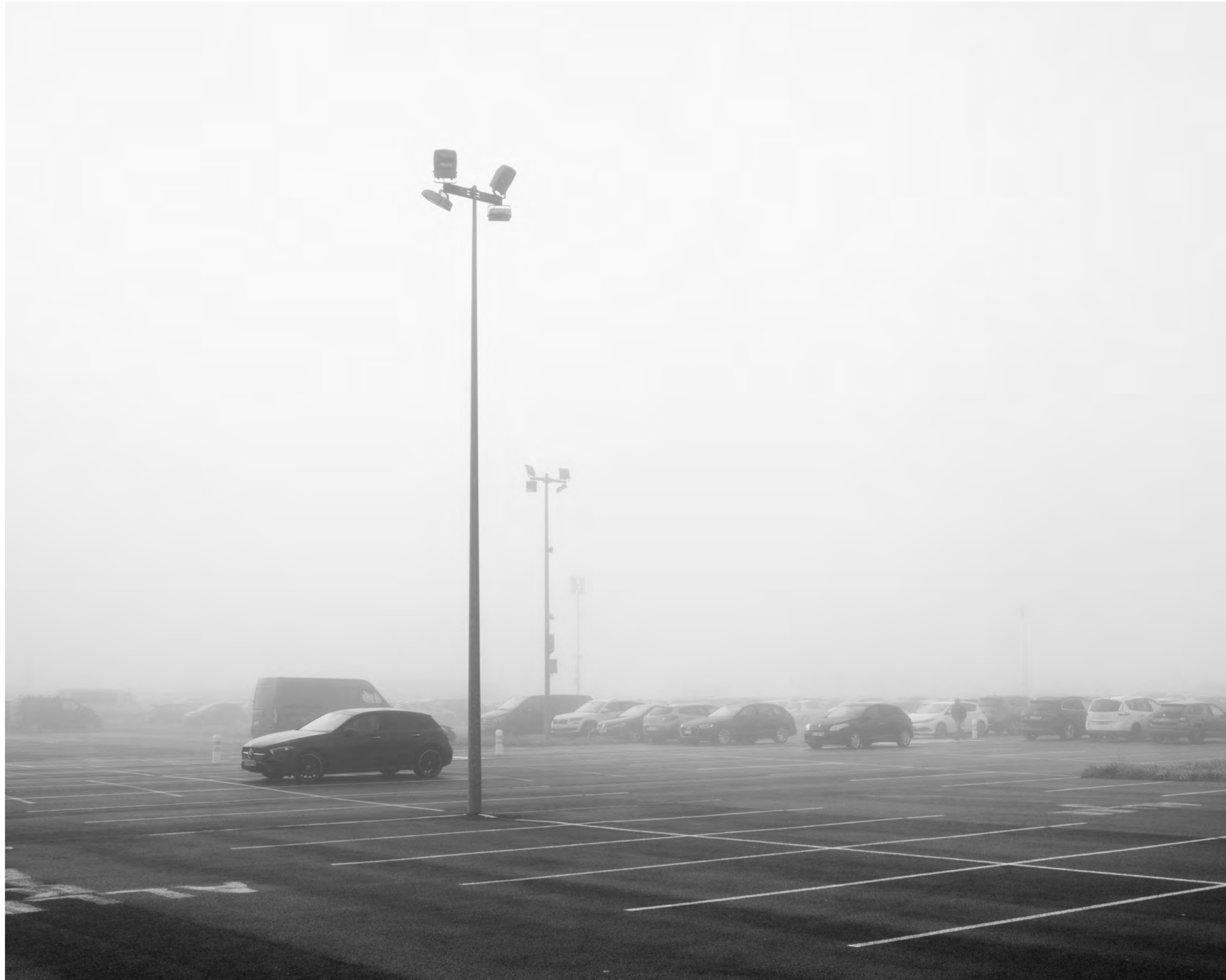
The fog outside the gate, #026