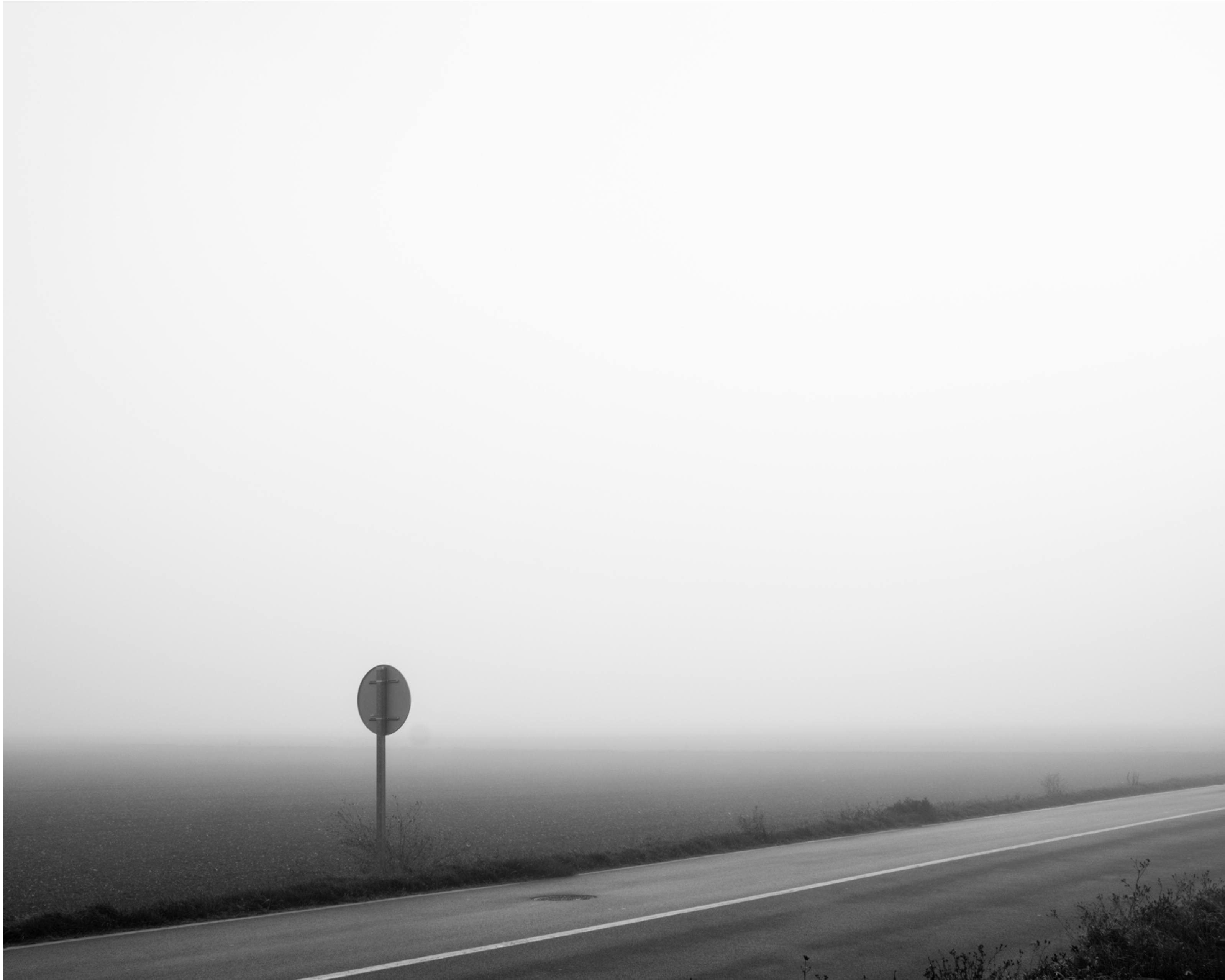
The fog outside the gate, #024