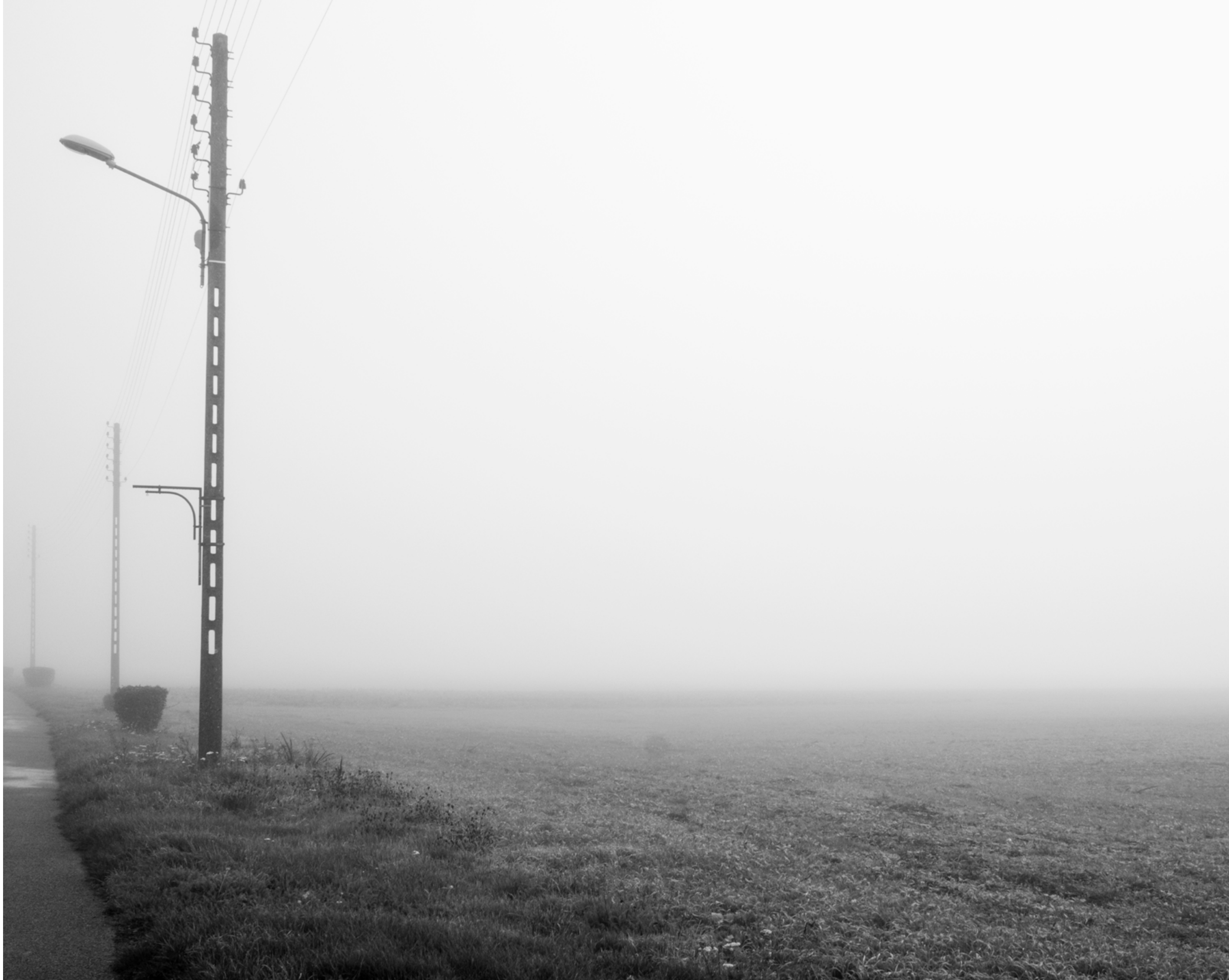
The fog outside the gate, #015