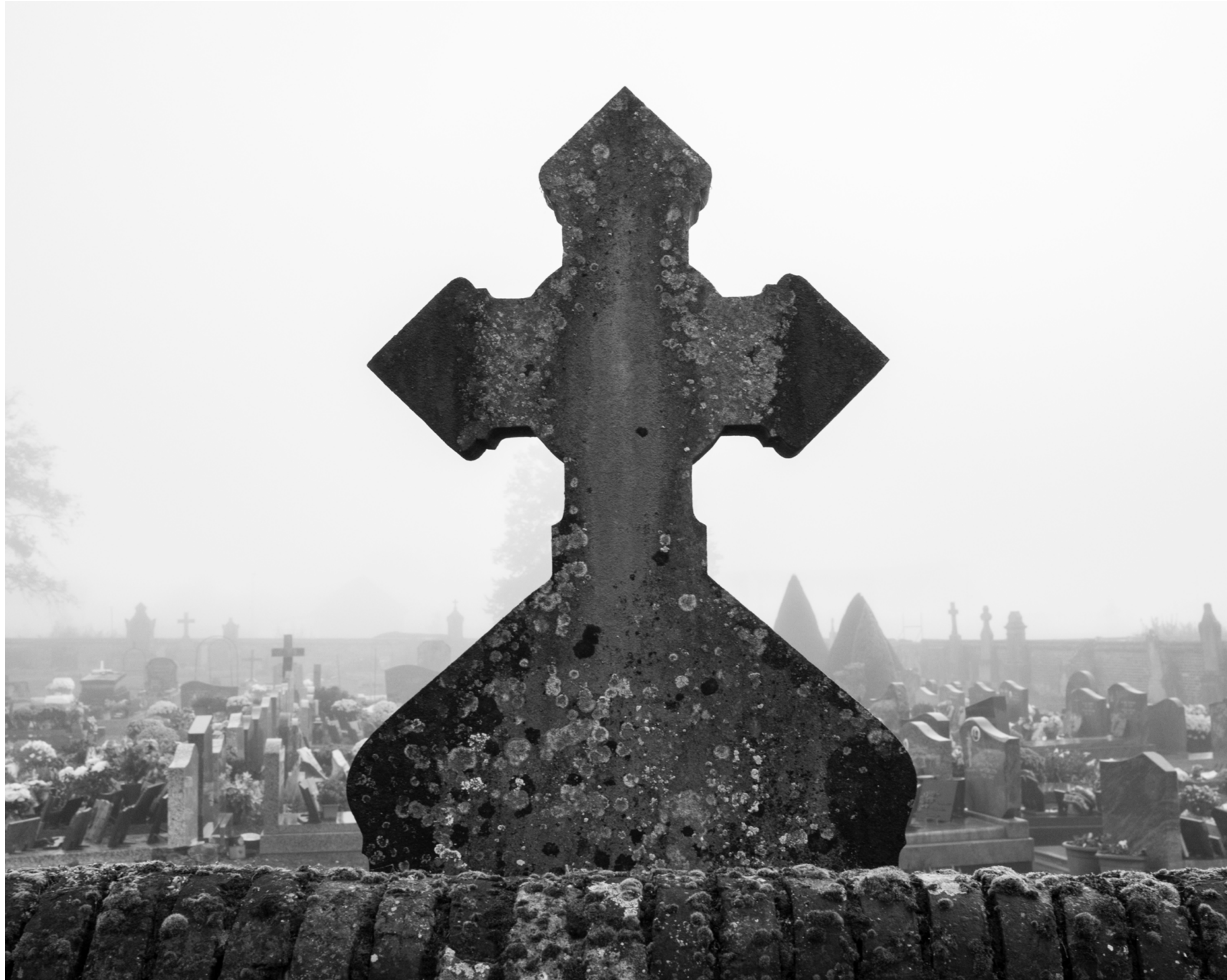
The fog outside the gate, #020