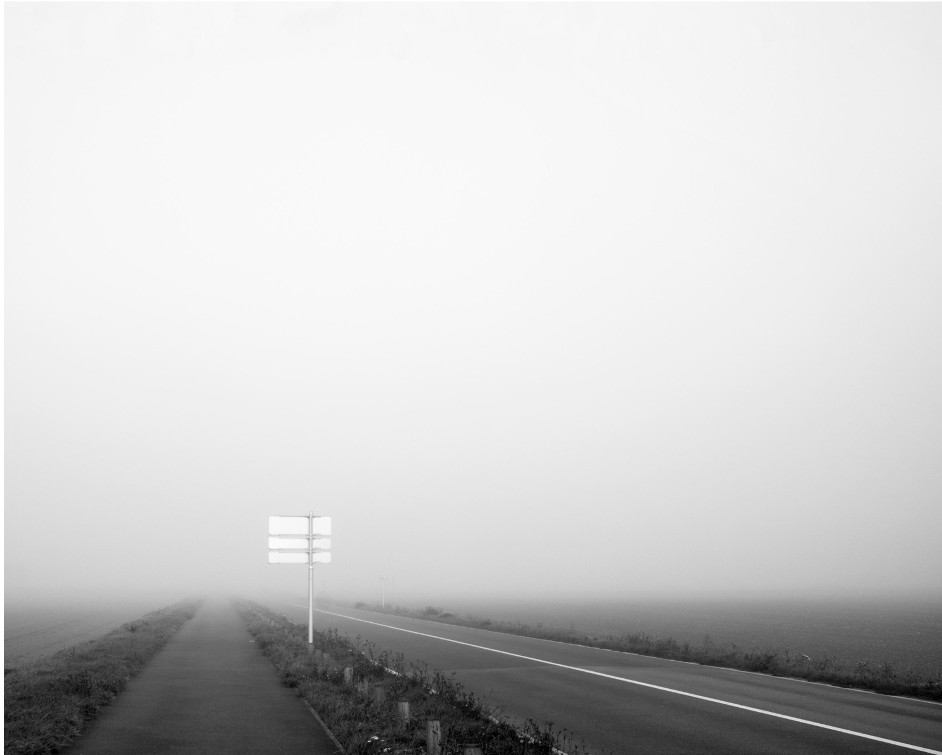
The fog outside the gate, #017