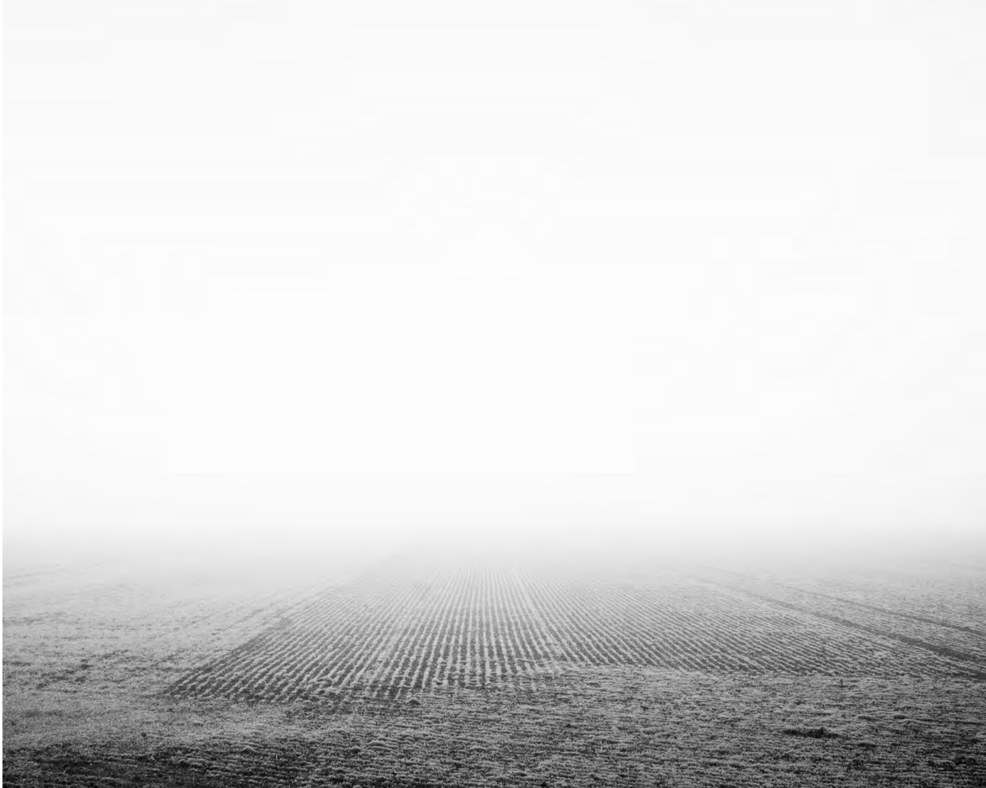
The fog outside the gate, #006