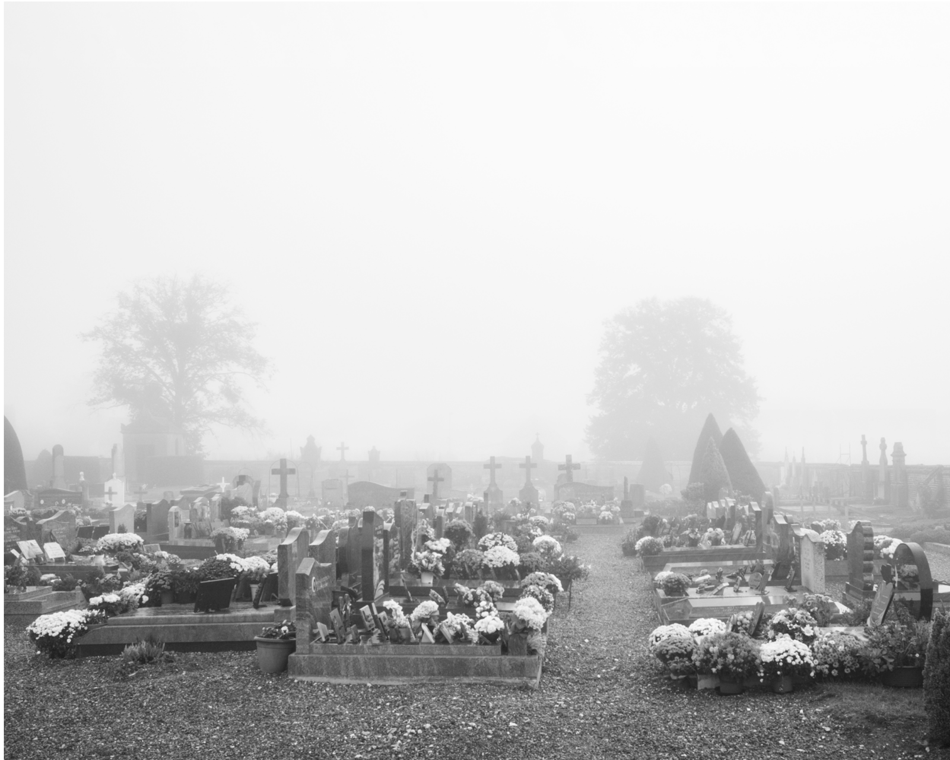
The fog outside the gate, #011