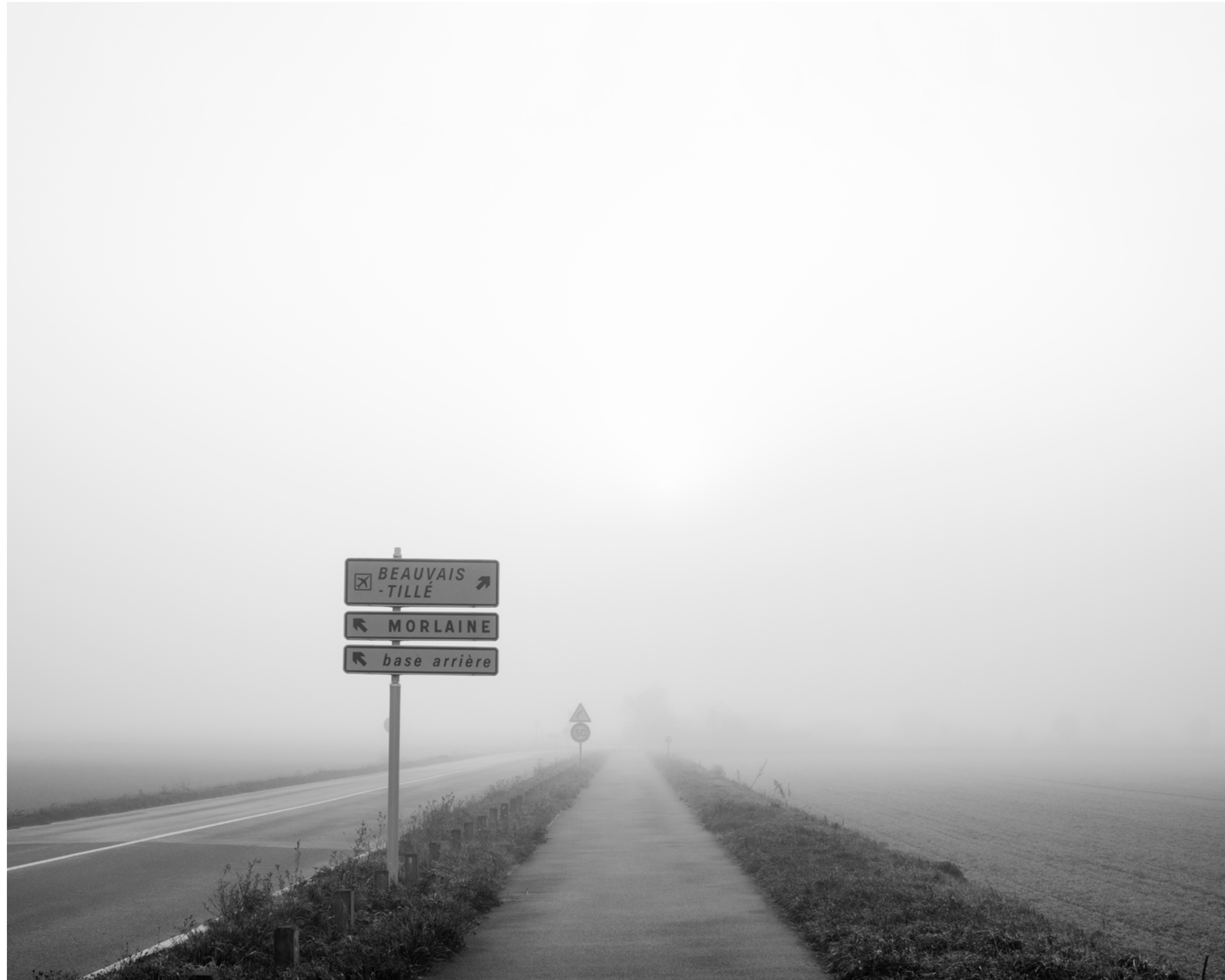
The fog outside the gate, #016