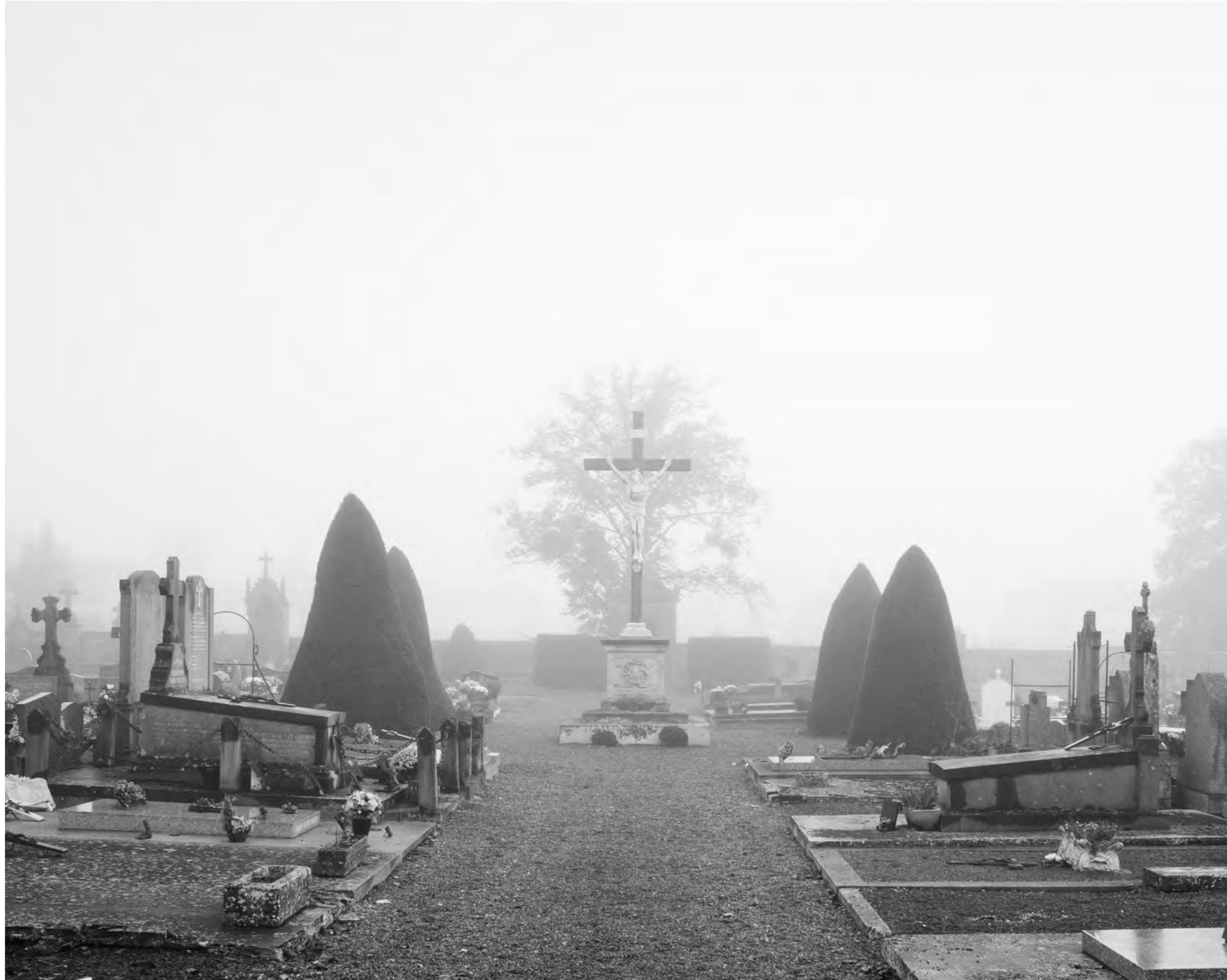
The fog outside the gate, #010