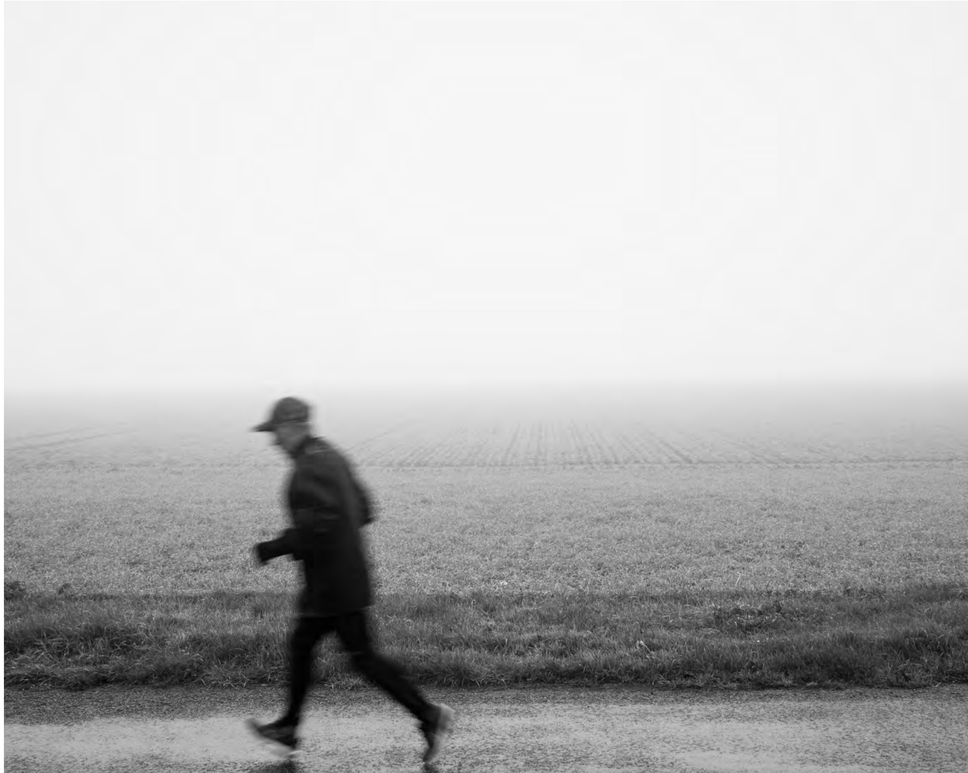
The fog outside the gate, #025