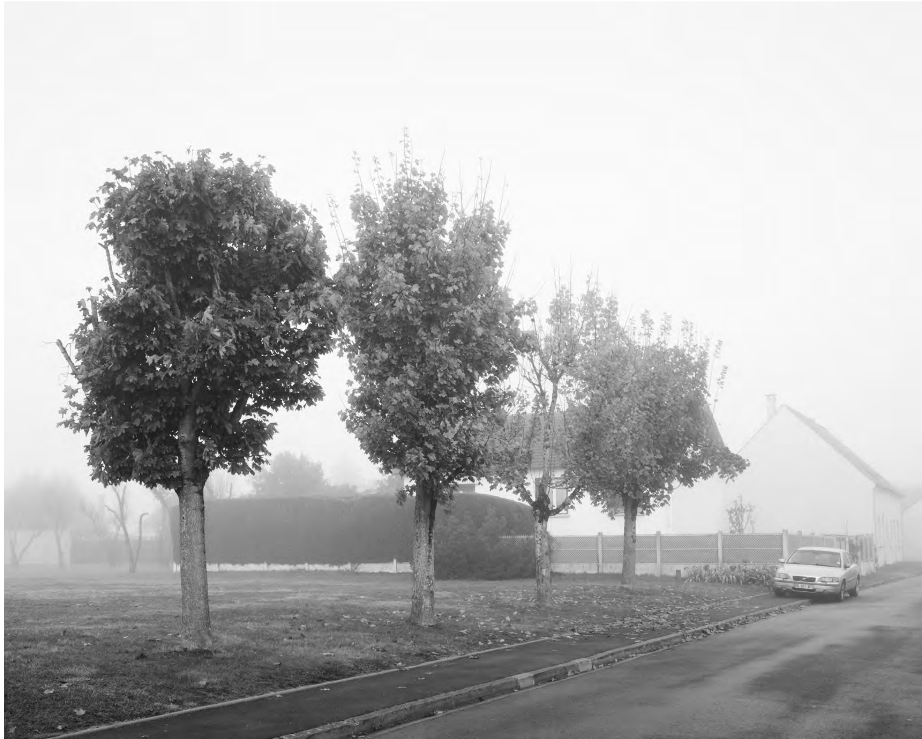
The fog outside the gate, #005