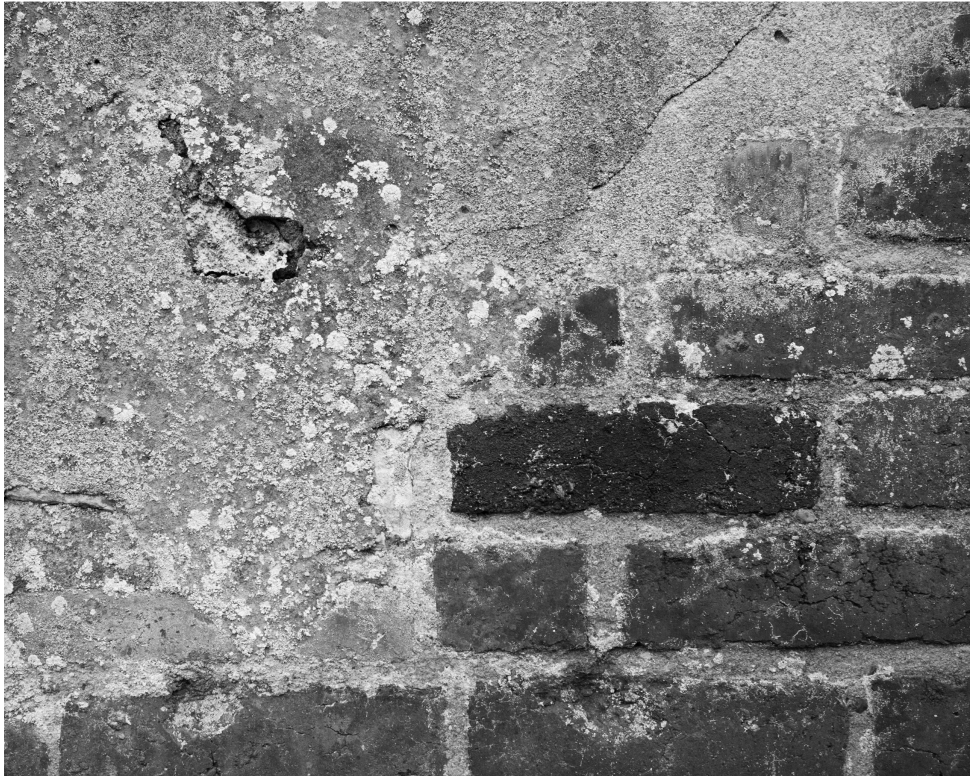
The fog outside the gate, #009