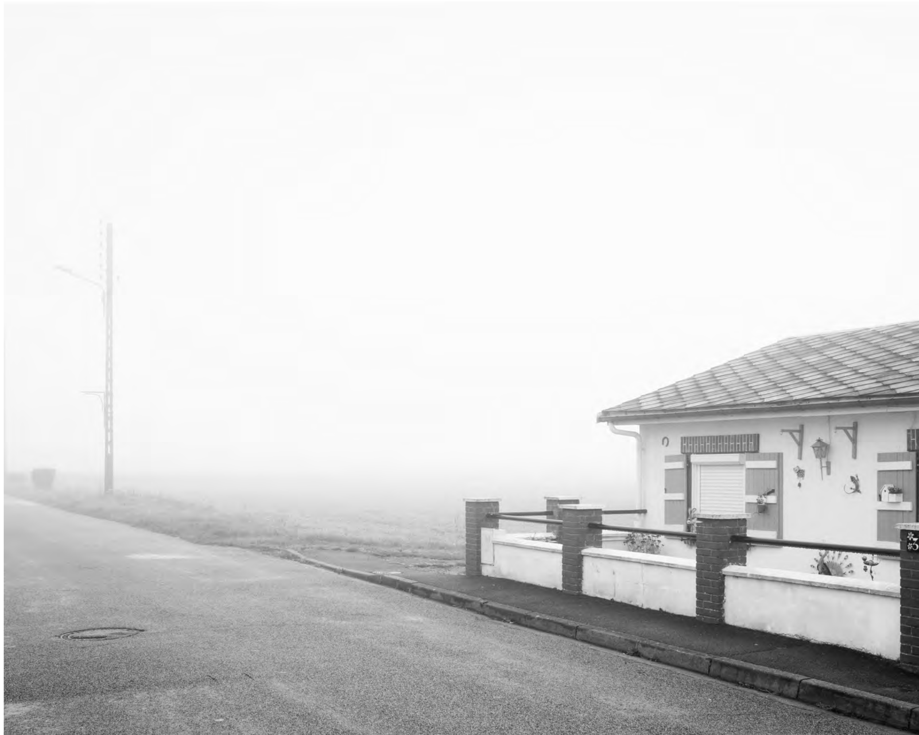
The fog outside the gate, #014