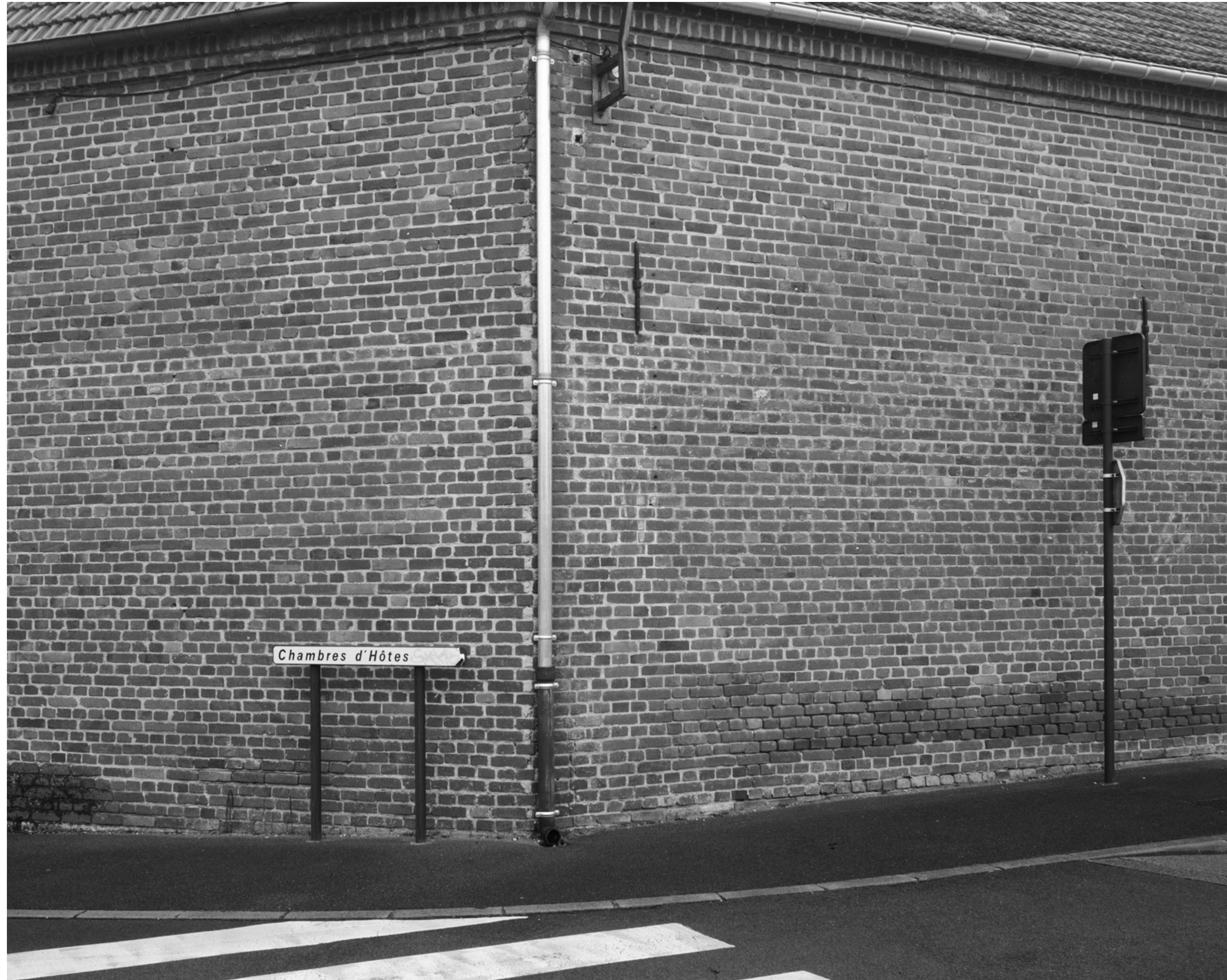
The fog outside the gate, #004