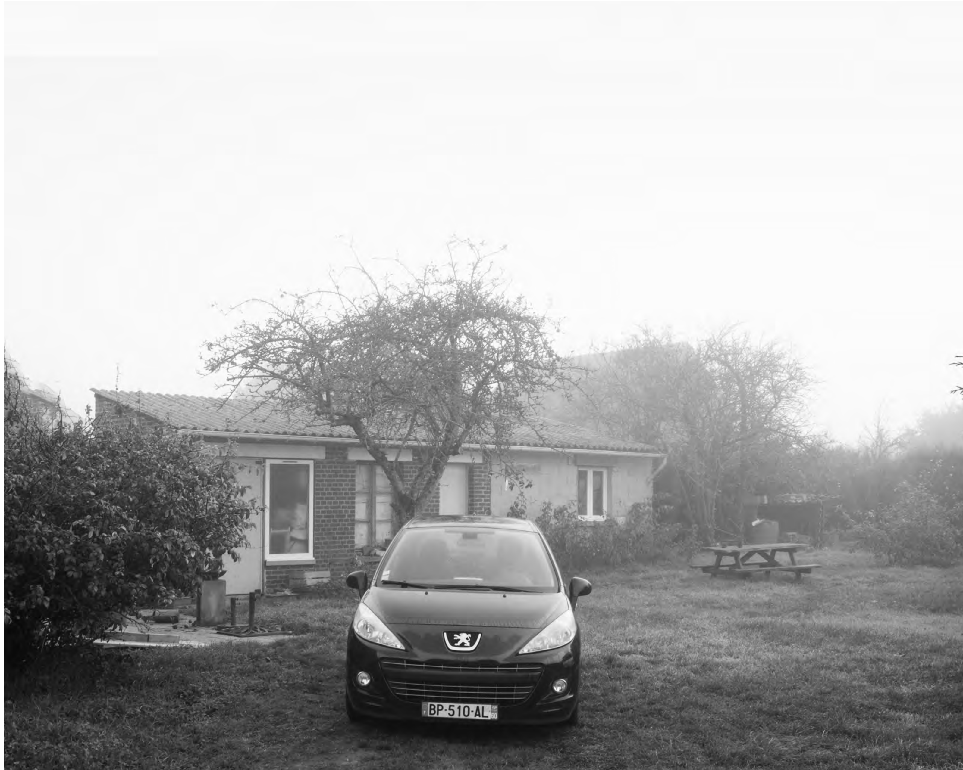
The fog outside the gate, #023