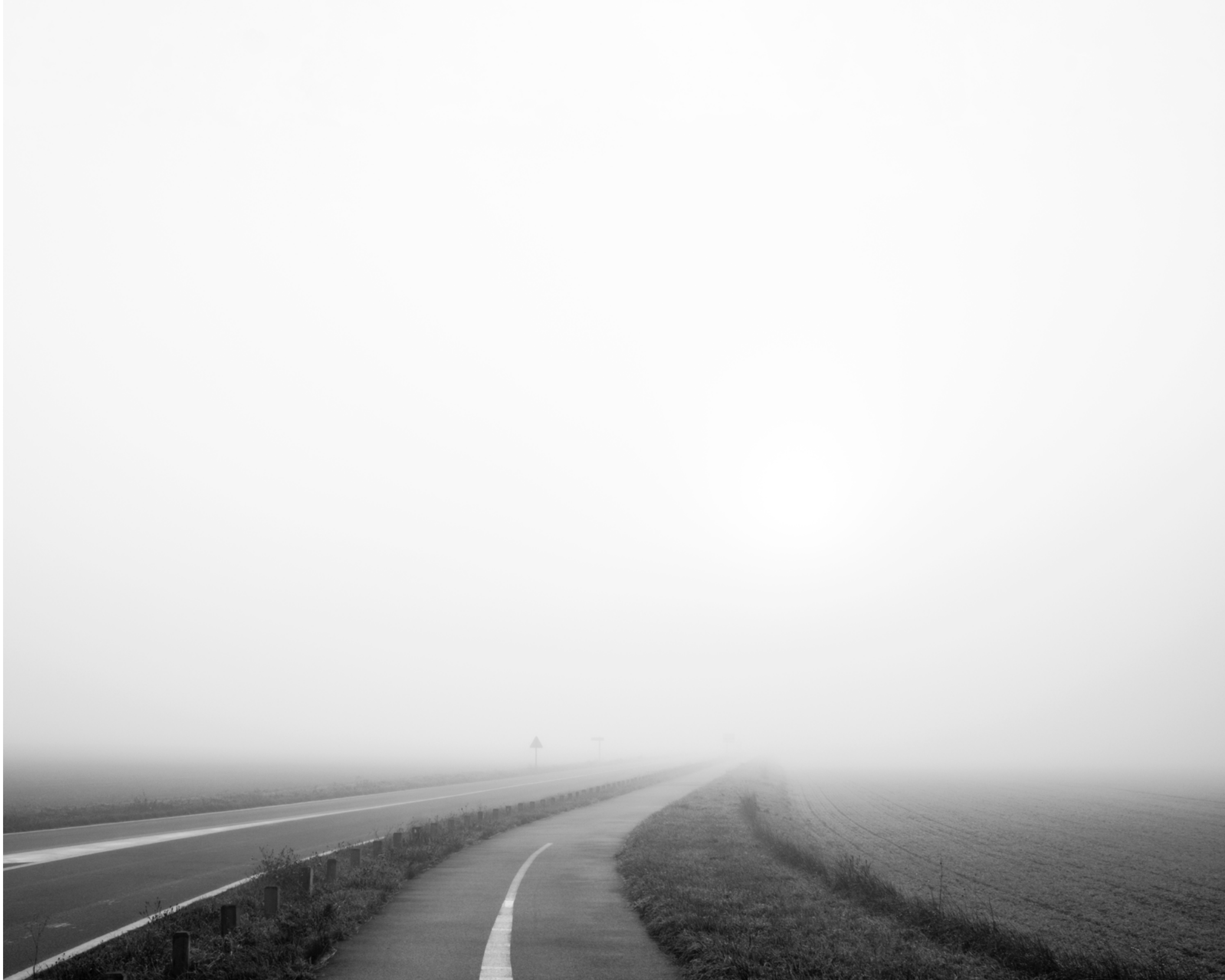
The fog outside the gate, #022