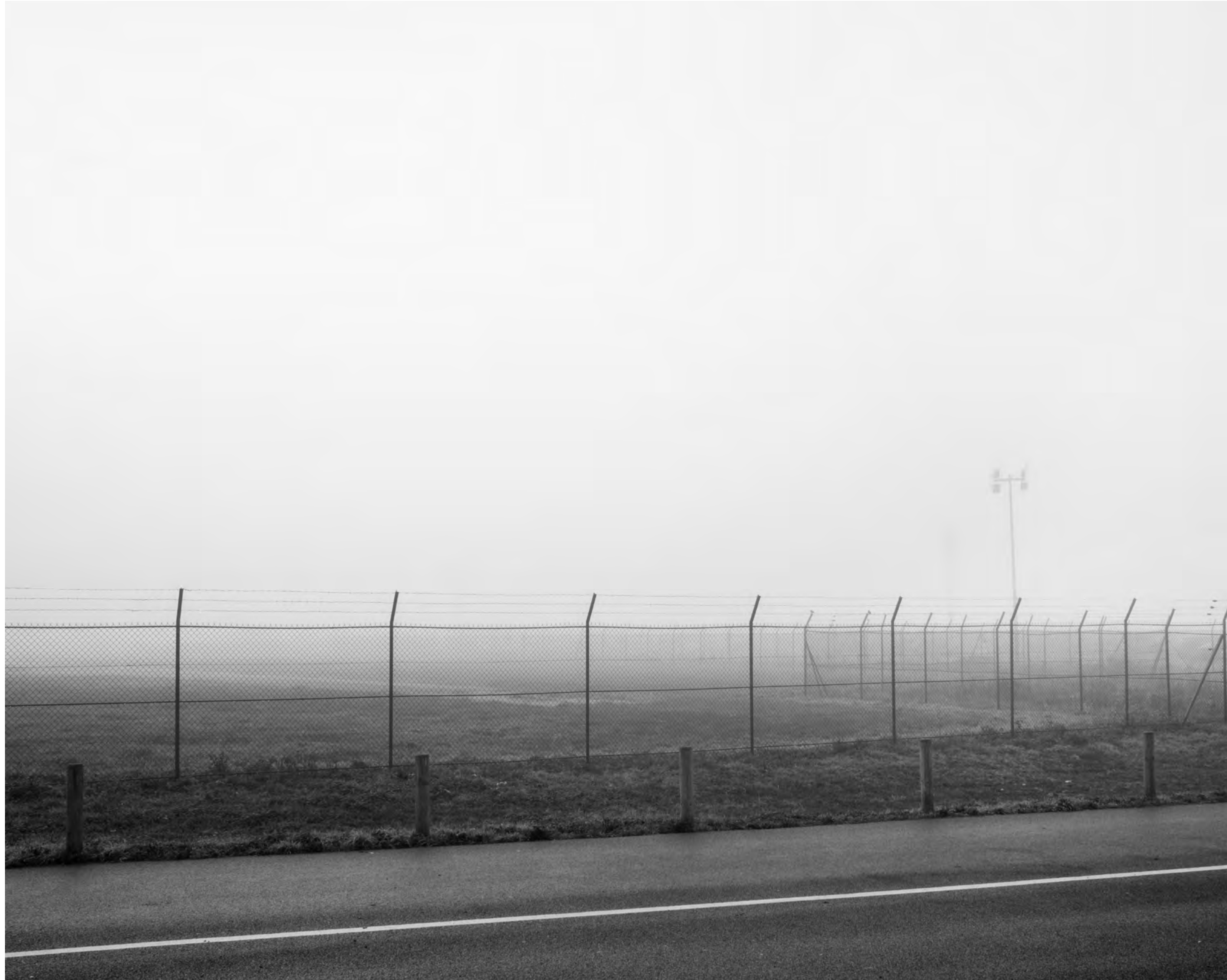
The fog outside the gate, #001