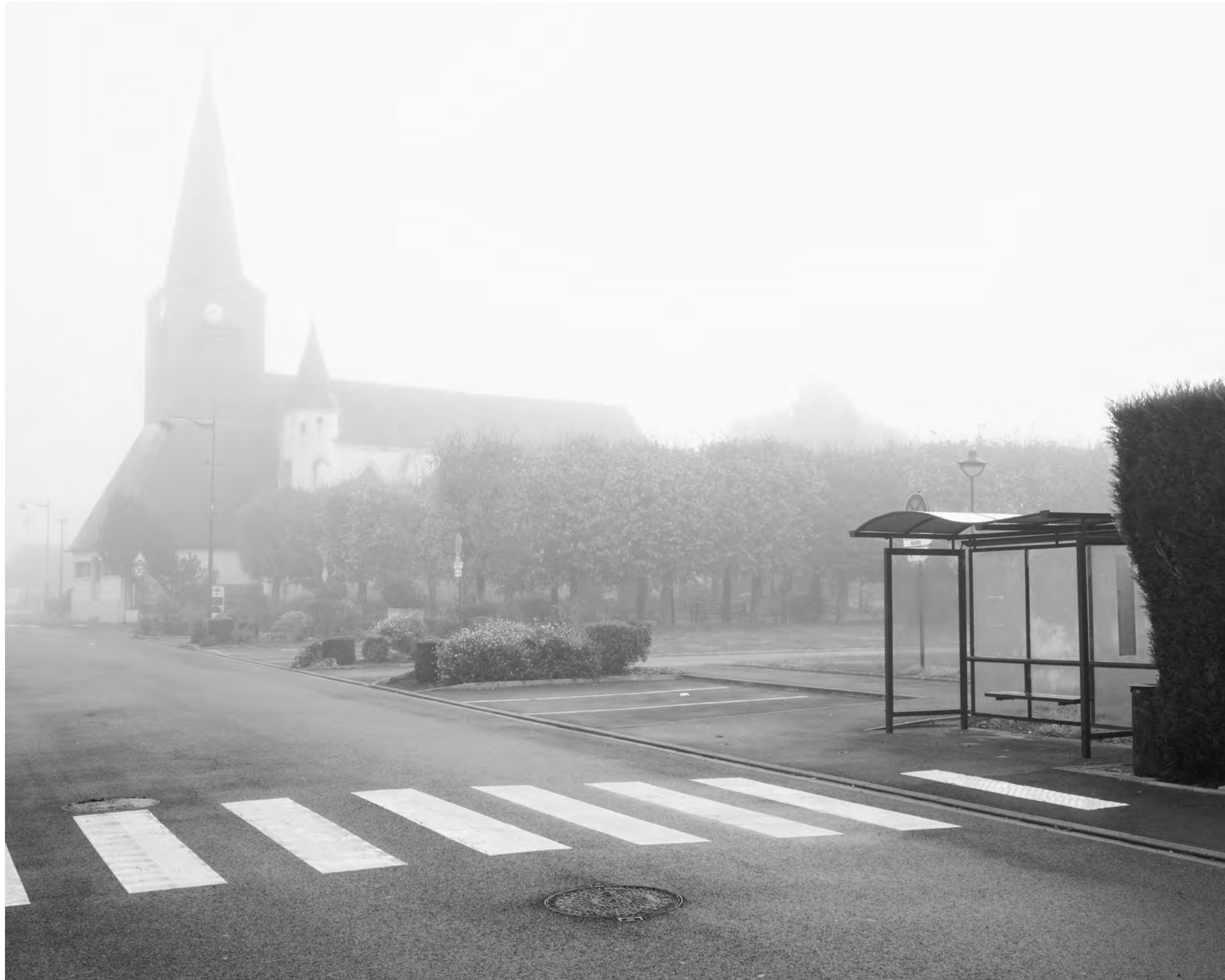
The fog outside the gate, #021