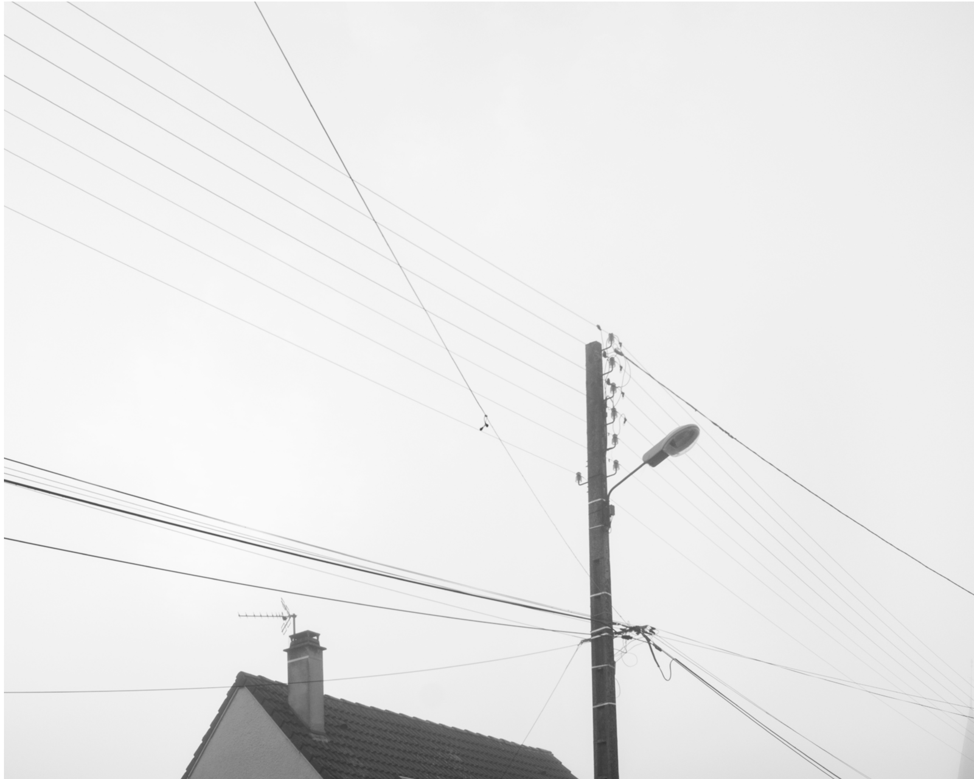
The fog outside the gate, #007