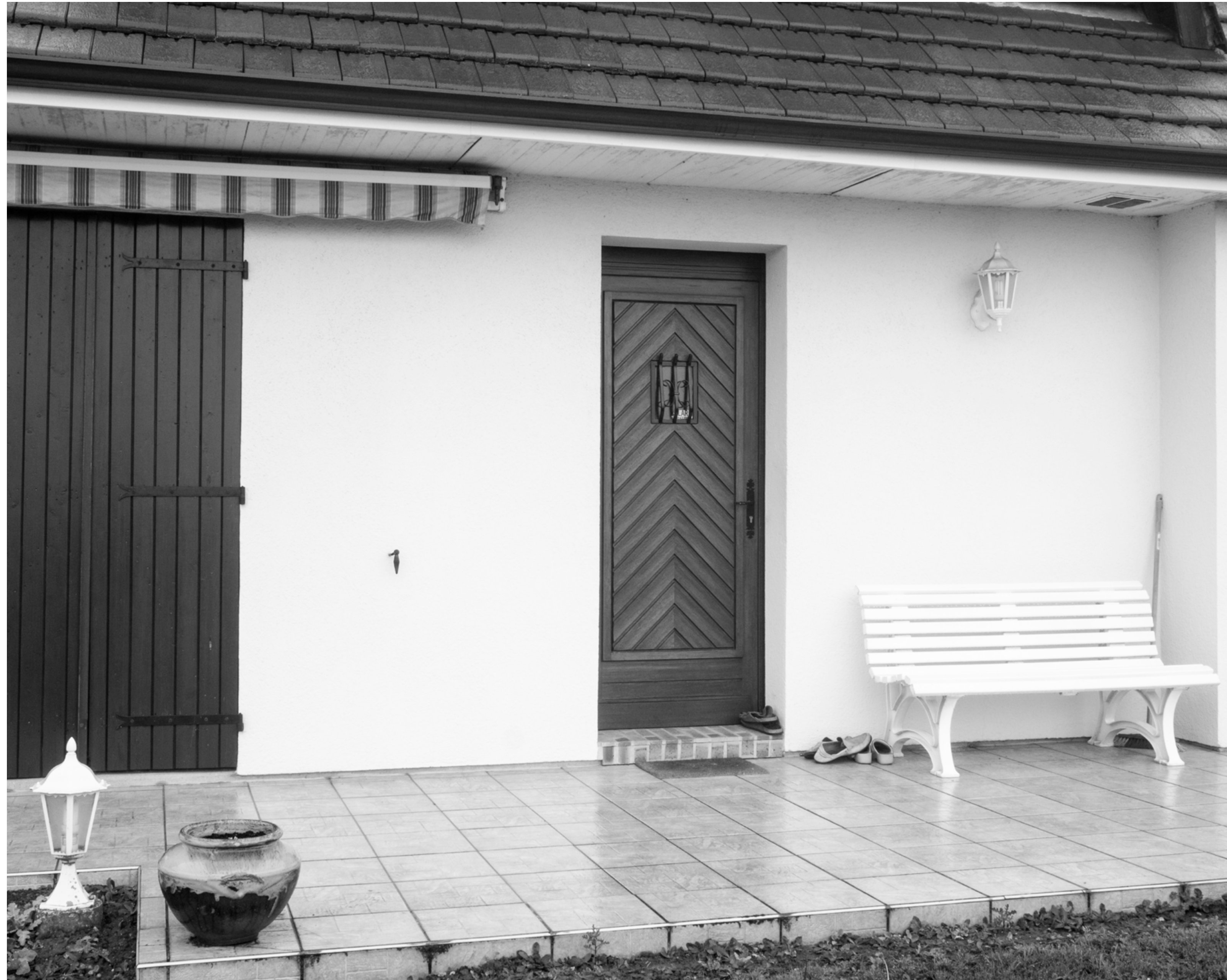
The fog outside the gate, #019