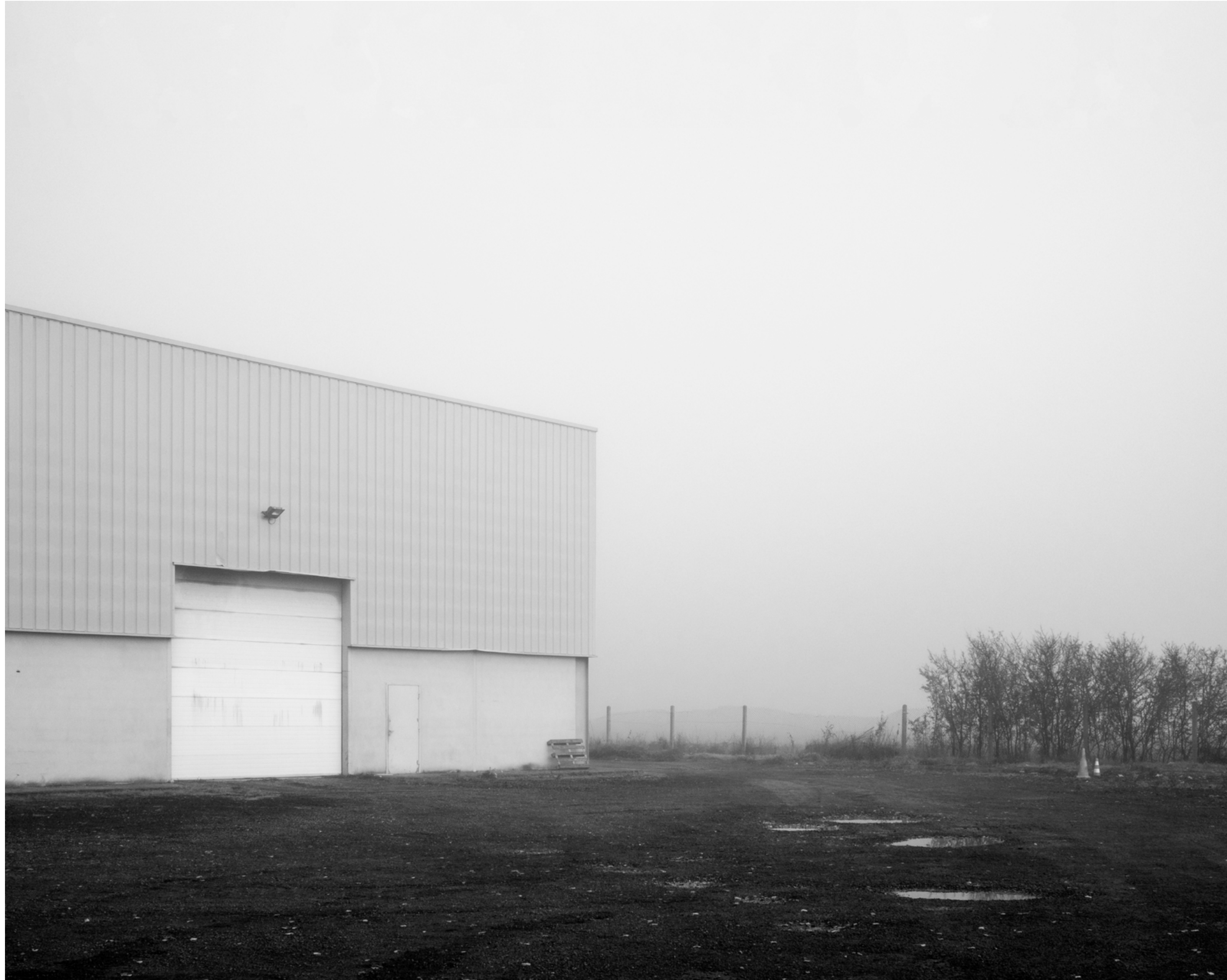
The fog outside the gate, #003