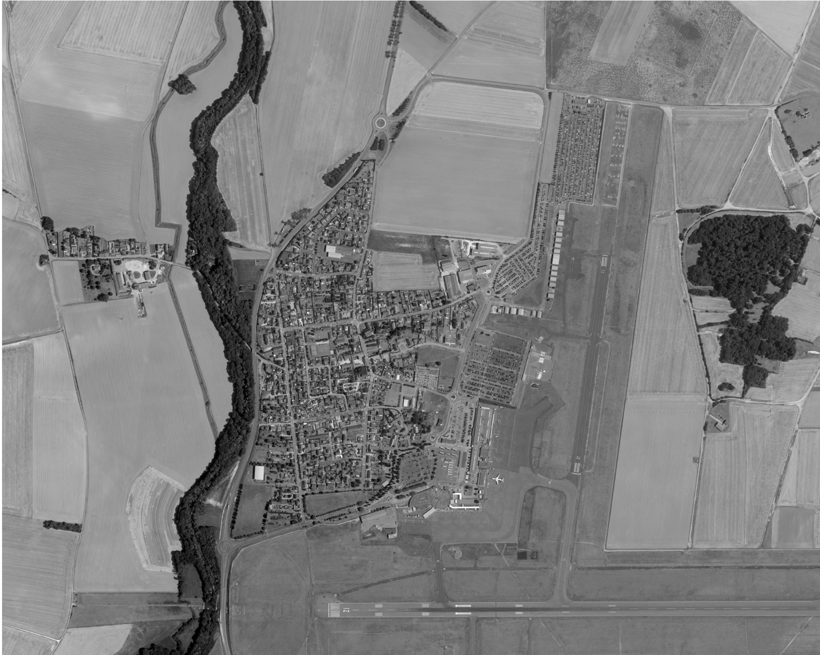
The fog outside the gate, #000