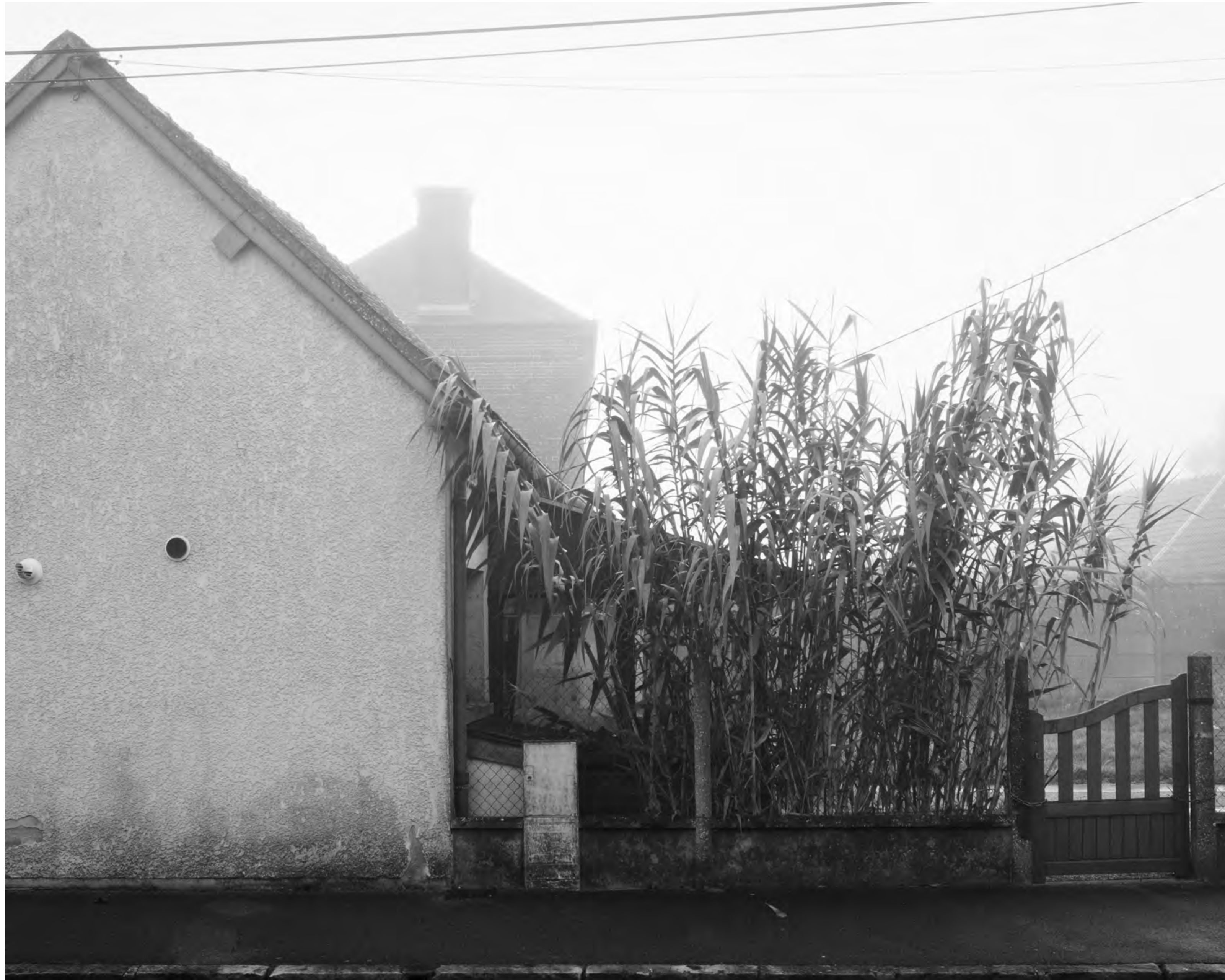
The fog outside the gate, #008